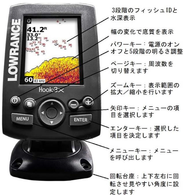
HOOK-3X+アイスフィッシングアダプター 19,800 円

45 センチのシャフトにスキマー振動子をセッットし2コの強力吸盤でアイスボックスなどに固定します。氷が厚いときは付属のロープで吊り下げることができます。