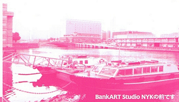
BankART Studio NYKの前です